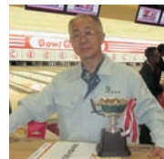
団体優勝 （株）阿部塗装工業